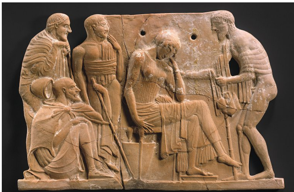
Terre cuite grecque (460-450 av J.-C.).